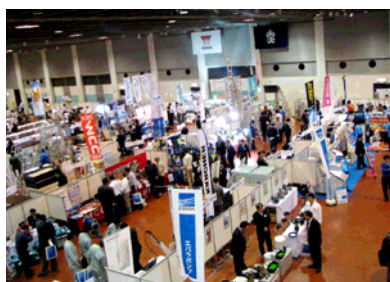
東北各県より1,500名超の皆様にご来場いただきました。

太陽光発電システム、太陽熱温水器、蓄電池などの創エネ・節電・省エネ機器、システムバス・キッチン、エアコン、給湯器、LED照明などの住宅設備機器等、被災地の復旧・復興を支援する商品・機器を提案しました。