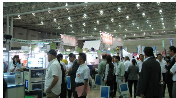
テーマゾーン内で行ったプレゼンテーション形式の クイズラリーには多くの方にご参加いただきました

「グランドフェア2014」にご来場いただきました皆様をはじめ、開催にご尽力いただきました皆様に対し心より感謝申し上げます。次回以降開催のグランドフェアにつきましても変わらぬご支援を賜りますようお願い申し上げます。