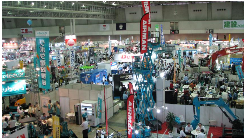
全国5会場で6万175名のご来場をいただきました