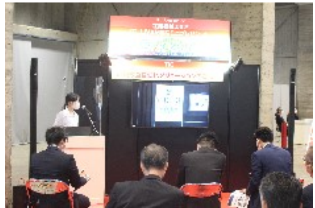
（L I V E配信の様子）

今回のグランドフェアは、コロナ禍での展示会として、感染症拡大防止策を十分に講じつつ、実機展示だけでなくWEBを活用した情報発信を積極的に活用することにより、幅広い分野の多岐にわたる商品をご紹介しますとともに、実演や体験可能な展示を多数ご用意いたしました。