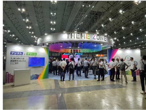
(グランドフェアの様子)